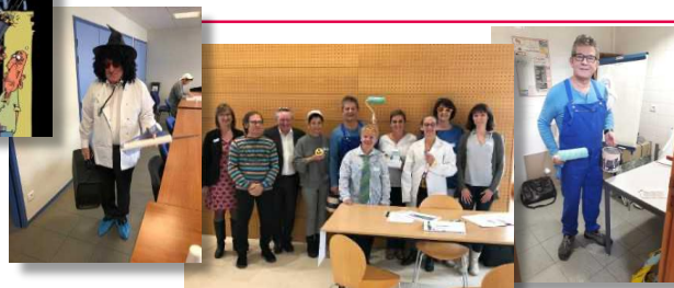
Serious Game Panique à la maison de retraite (2019)